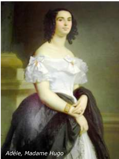
Adèle, Madame Hugo

Hun ogen vangen elkaar, hun blikken houden elkaar vast. Hij zal het zich later met volgende woorden herinneren: 'Le jour où ton regard a rencontré mon regard, pour la première fois, un rayon est allé de ton cœur au mien, comme de l'aurore à une ruine.' Want op dat moment is zijn 31-jarig hart een ruïne. Zijn vrouw Adèle papt immers aan met één van zijn goede vrienden Sainte-Beuve. Juliette wil voor het voetlicht schitteren, maar haar inkomsten haalt ze op dat moment hoofdzakelijk ergens anders. Ze laat zich onderhouden door een Russische prins. Haar naam Juliette Gauvin heeft ze veranderd in Juliette Drouet, waarbij we vaak zien dat ze Droüet schrijft. In het theater is het kortweg Mlle. Drouet.