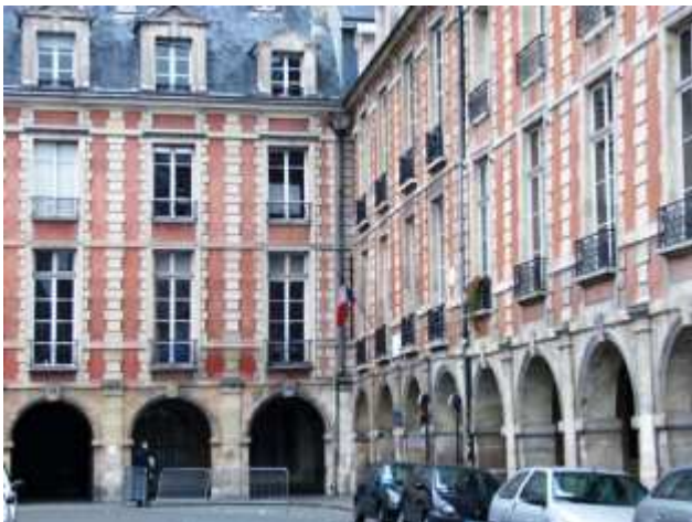
Parijs, Place de Vosges

wil deze opdracht volbrengen. Goed gek, ik geef het toe. Vlakbij ligt het optrekje haar door de Russische prins aangeboden. Ook hier is het plafond van de slaapkamer hun hemel. De geliefden zien elkaar dagelijks. Het gebouw ligt in een rustige buurt en oogt momenteel minder mooi dan haar vorige verblijf. Madame Hugo is blijkbaar op de hoogte van de liaison van haar man, maar tilt er niet zwaar aan. Zij heeft immers de handen vol met haar minnaar. Het echtpaar Hugo woont op dat moment op de Place des Vosges (Vogezen) in een hoekhuis op de tweede verdieping. Op dat moment nog de Place Royale genoemd. Leuk detail is dat Hugo verwekt is op de hoogste top van de Vogezen.