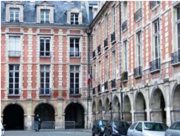
Parijs, Place de Vosges

wil deze opdracht volbrengen. Goed gek, ik geef het toe. Vlakbij ligt het optrekje haar door de Russische prins aangeboden. Ook hier is het plafond van de slaapkamer hun hemel. De geliefden zien elkaar dagelijks. Het gebouw ligt in een rustige buurt en oogt momenteel minder mooi dan haar vorige verblijf. Madame Hugo is blijkbaar op de hoogte van de liaison van haar man, maar tilt er niet zwaar aan. Zij heeft immers de handen vol met haar minnaar. Het echtpaar Hugo woont op dat moment op de Place des Vosges (Vogezen) in een hoekhuis op de tweede verdieping. Op dat moment nog de Place Royale genoemd. Leuk detail is dat Hugo verwekt is op de hoogste top van de Vogezen.